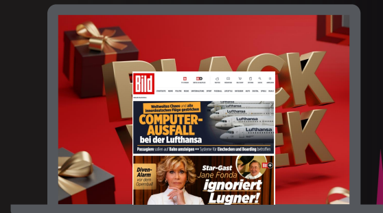
BILLBOARD + DOUBLE DYNAMIC SITEBAR (PREMIUM CONTENTBAR)

29.11. bis 02.12. 42 Mio. Als / TAG PREIS / TAG: 490.000 €