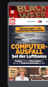
LEAD AD (OPTIONAL)