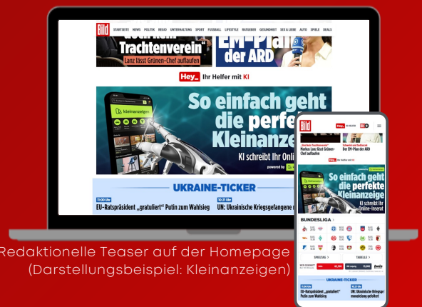
Redaktionelle Teaser auf der Homepage (Darstellungsbeispiel: Kleinanzeigen)

Klassische Display Anzeigen umrahmen die Hey_BILD Seite.