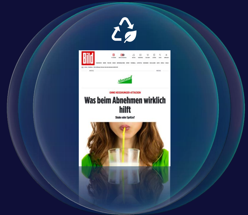
BILD Brand Story

Die Refresh Story stellt eine umweltfreundliche und effektive Marketingstrategie mit wiederverwendbaren Content-Ideen dar. Deine Botschaft bleibt aktuell, dein ökologischer Fußabdruck klein!