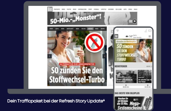
Dein Trafficpaket bei der Refresh Story Update 4

Preis je nach gebuchten Views / gebuchtem Product Story Paket 2 + 500,00 € Kreakosten 3