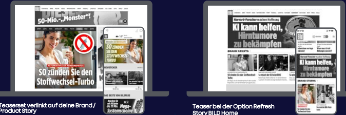
Teaserset verlinkt auf deine Brand / Product Story

Erfolgreiche Story langfristig auf der BILD Home erneut bewerben.