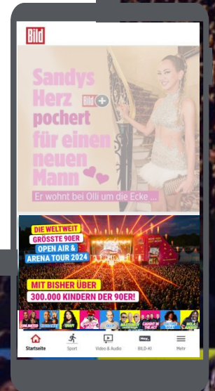
Scribble BILD Home stationär & mobil