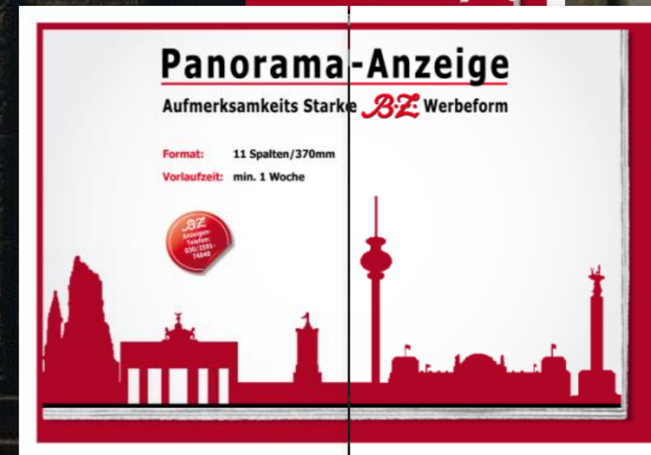
Mantel-Innenseiten-Panorama, Tabloid: (532 mm breit, 369 mm hoch)