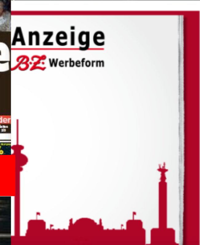
Mantel-Rückseite: 1/1 Seite Tabloid (257 mm breit, 369 mm hoch)