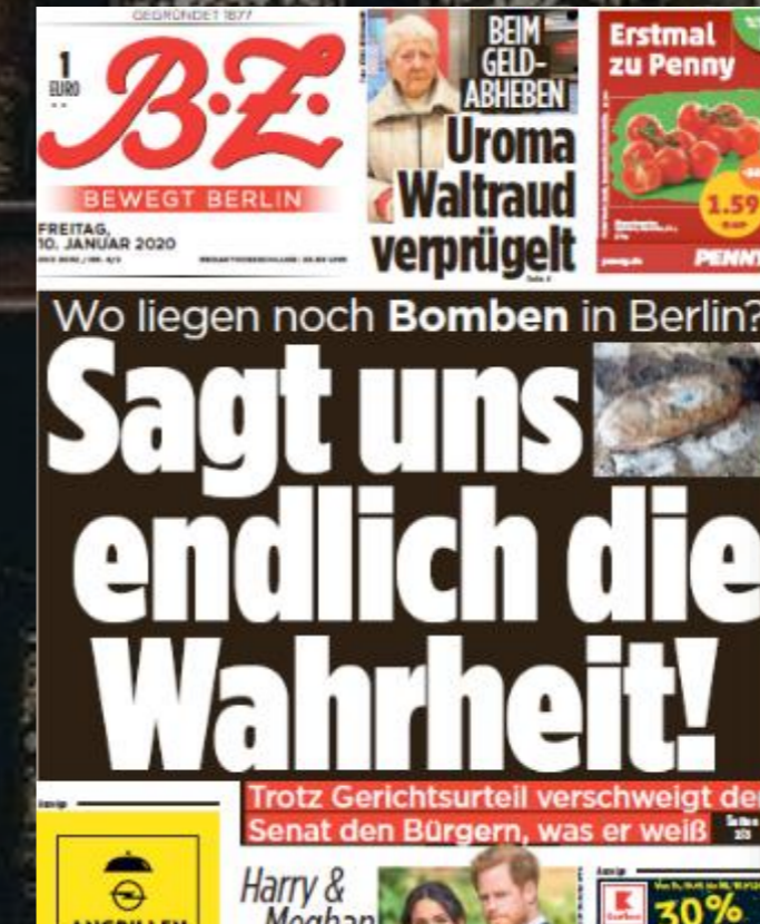
Mantel-Titelseite: Streifen 5-spaltig/ 40 mm hoch