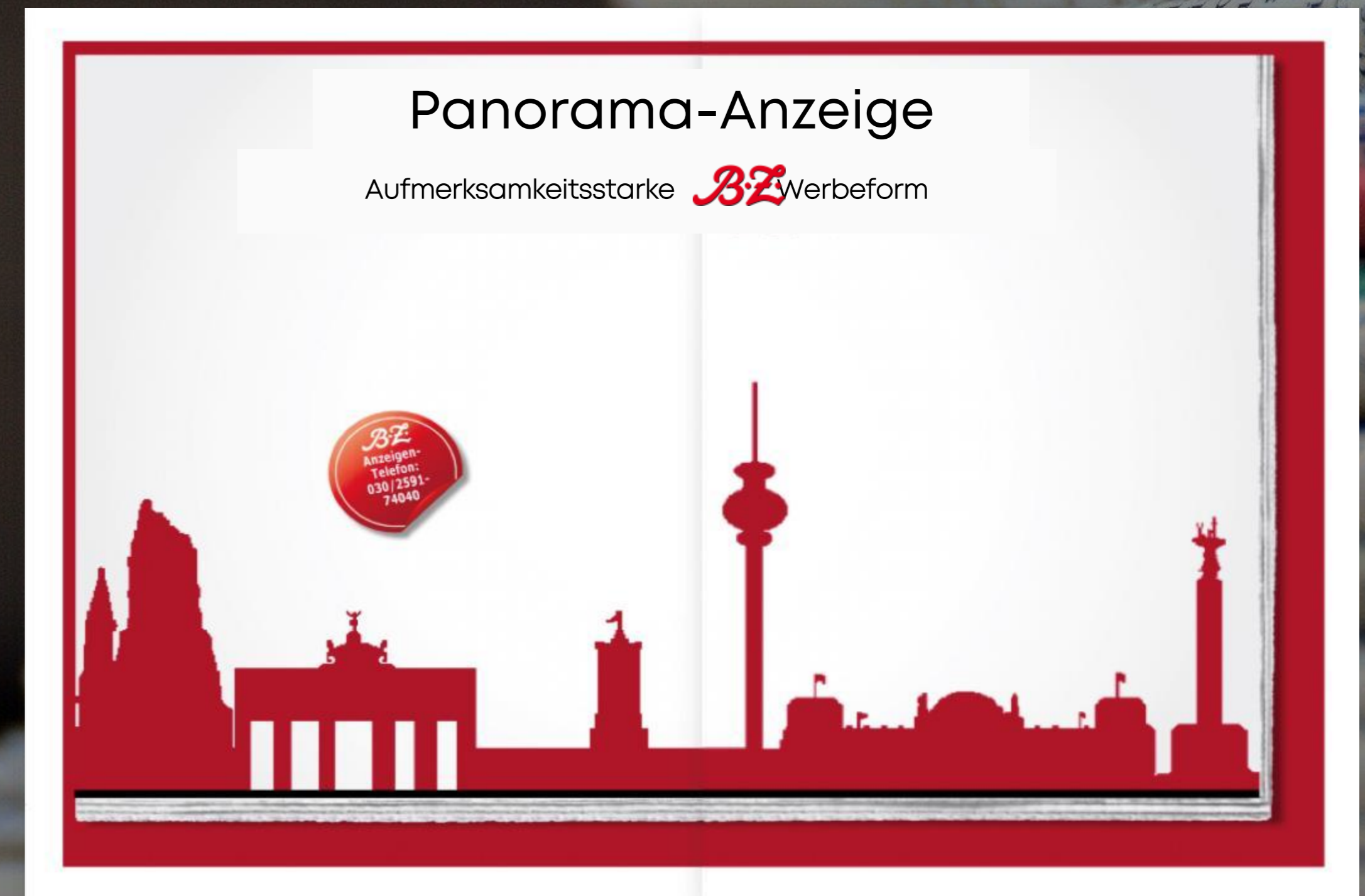
2/1 Panoramaseite über Bund, Heftmitte. Auf Anfrage möglich.