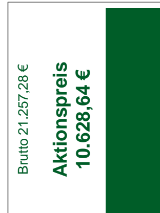
1/3 Seite (121 x 528 mm)