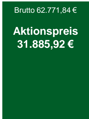
1/1 Seite (375 x 528 mm)