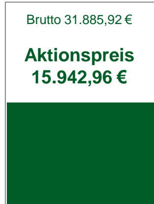
1/2 Seite (375 x 264 mm)