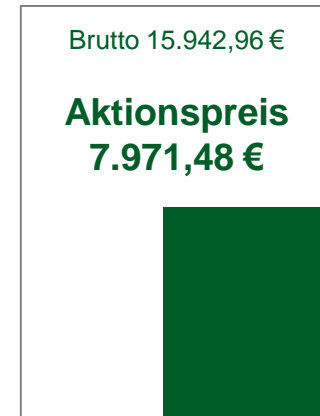
1/4 Seite Eck (184,5 x 250 mm)

Preise sind AE-fähig, Preise zzgl. MwSt., Aktionspreise nicht weiter rabattfähig. Weitere Formate auf Anfrage möglich. Direktpreis je mm 17,11 € (s/w-4c)